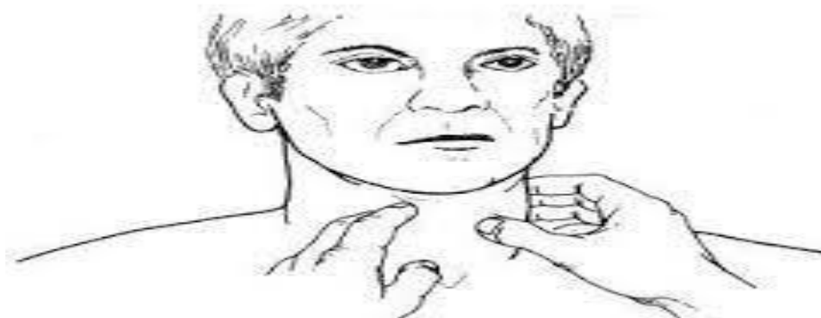
Fig. 4.21 Palpación de los lóbulos por la técnica de Lahey.

En la zona posterior se tiene la columna cervical que se explora así: con el pulpejo del dedo índice se identifican las apófisis espinosas de las vértebras cervicales; la más prominente, la séptima cervical, sirve de referencia límite entre el cuello y el tórax, y a partir de allí se cuentan las vértebras dorsales.