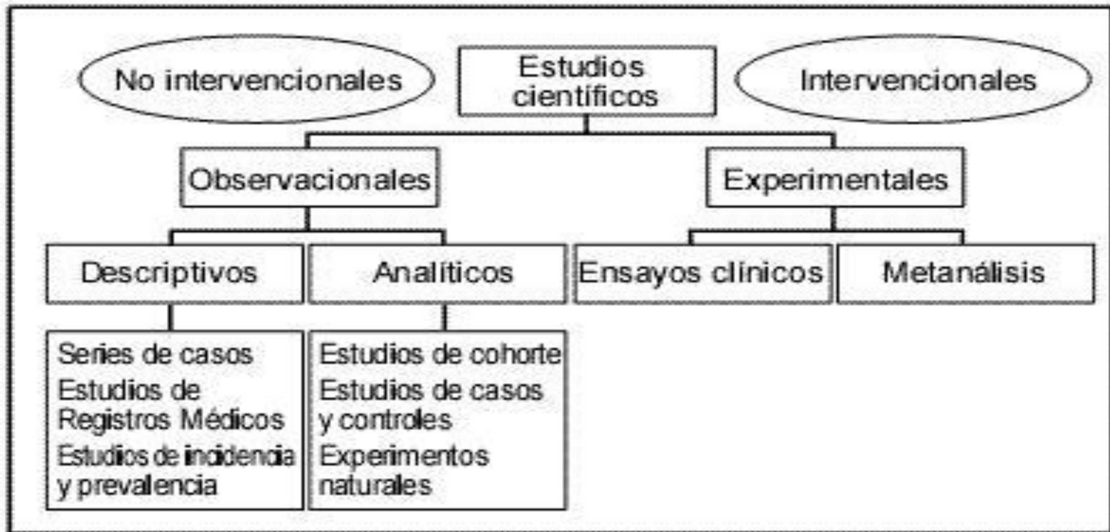
Figura 1. Clasificación de los estudios científicos según diseño.