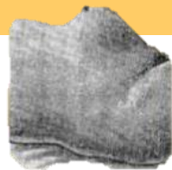
Signo del globo de seguridad de Pinard