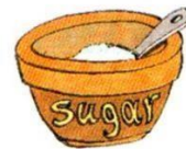
a bowl of sugar