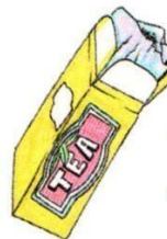
a packet of tea