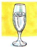
a glass of water