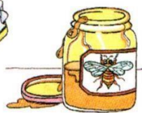
a jar of honey