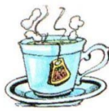
a cup of tea