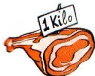
a kilo of meat