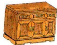
a piece of furniture