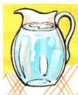
a jug of water