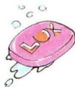
a bar of soap