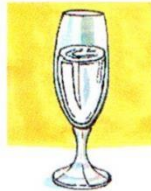
a glass of water