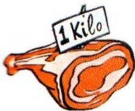
a kilo of meat