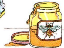
a jar of honey