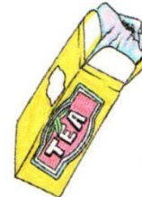
a packet of tea