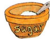
a bowl of sugar