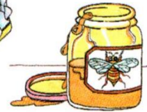
a jar of honey