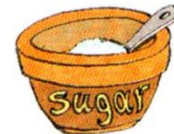
a bowl of sugar