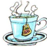
a cup of tea