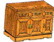
a piece of furniture