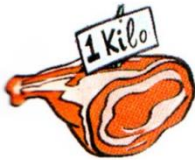
a kilo of meat