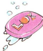
a bar of soap