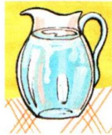
a jug of water