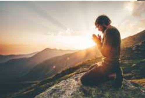
Imagen espiritual. Creencias, valores, principios y todo lo que se llevara a cabo en busca de la verdad de las cosas

Cuatro preguntas que nos realizamos. 1. ¿Qué cambios quiero realizar? 2. ¿Para qué? 3. ¿Con que objetivo? 4. ¿Con que efectos?