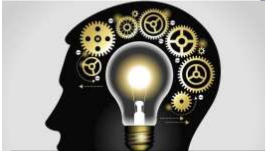
Imagen intelectual. Conocimientos empíricos, académicos, políticos, sociales y culturales

Imagen espiritual. Creencias, valores, principios y todo lo que se llevara a cabo en busca de la verdad de las cosas