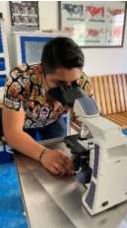
Fig. 2 búsquedas en microscopio