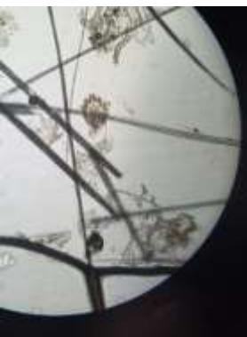
Fig. 4 Acaro de sarna sarcóptica encontrado del muestreo, realizado.