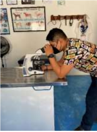
Fig.1 búsqueda de ácaros en microscopios