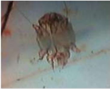
Imagen 01 Sacoptes scabiei

flora normal de la piel. Se piensa que la transmisión de los ácaros ocurre en el período inmediatamente posterior al nacimiento durante episodios de contacto estrecho como el amamantamiento. Esto contribuye posiblemente a que los lugares predilectos de la forma localizada son alrededor de los ojos y el hocico.