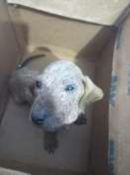
Fig. 3 Perro de muestra para realizar un raspado