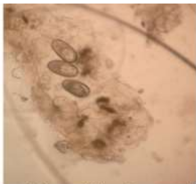
Figura 3. Huevos del ácaro Sarcoptes scabiei

La técnica consiste en arrastrar la cuchilla en sentido del crecimiento del pelo, mediante movimientos cortos y repetidos hasta obtener sangrado capilar abundante en el caso de que el veterinario sospeche que nos encontramos ante un caso de sarna sarcóptica, el raspado deberá ser muy extenso y superficial, con el fin de obtener la mayor cantidad de muestra procedente del estrato corneo epidérmico, que es el lugar donde se aloja este parásito, ya que la hembra de sarcoptes scabiei excava galerías en los estratos más superficiales de la epidermis para depositar posteriormente allí sus huevos.