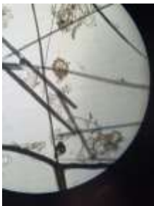
Fig. 4 Acaro de sarna sarcóptica encontrado del muestreo, realizado.