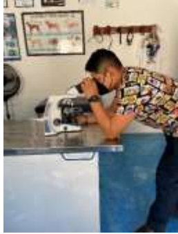
Fig.1 búsqueda de ácaros en microscopios