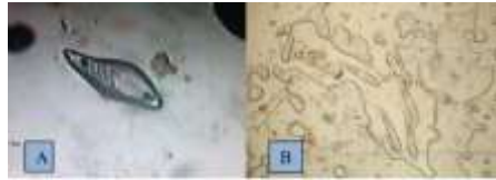
Imagen 04 A. Huevo Demodex canis . B. Demodex canis adulto

El ácaro Demodex canis puede encontrarse en los folículos pilosos de la mayoría de los perros donde se alimenta de sebo y del contenido de las células epiteliales del folículo piloso. (Méndez, 2017) Se considera que forma parte de la