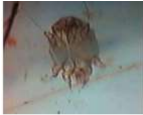
Imagen 01 Sarcoptes scabiei

flora normal de la piel. Se piensa que la transmisión de los ácaros ocurre en el período inmediatamente posterior al nacimiento durante episodios de contacto estrecho como el amamantamiento. Esto contribuye posiblemente a que los lugares predilectos de la forma localizada son alrededor de los ojos y el hocico.