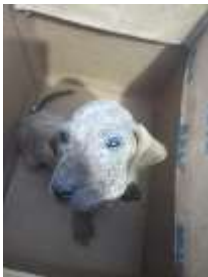
Fig. 3 Perro de muestra para realizar un raspado