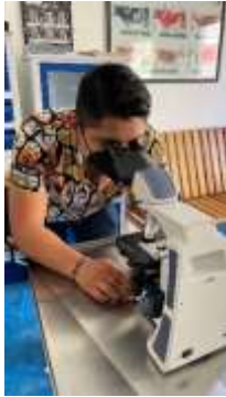
Fig. 2 búsquedas en microscopio