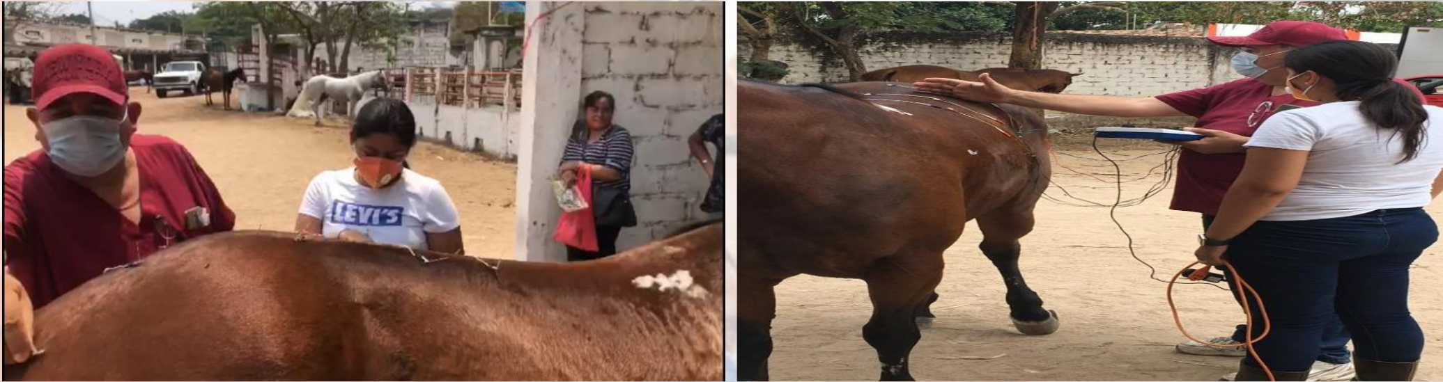
Ilustración 1 Tratamiento del dorso en yegua

escaramucera, después de haber tenido una lesión muscular, en las ejecuciones de los ejercicios, va de la mano una mal herrada que provocó una lesión a nivel escapula. Y la yegua tubo un exceso de estrés. Con la acupuntura ayudo a disminuir el dolor y a relajar al animal.