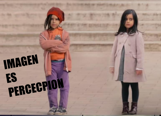
IMAGEN ES PERCEPCION

IMAGEN PUBLICA la percepción compartida que provocará una respuesta colectiva unificada.