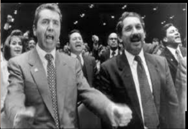
IMAGEN PUBLICA la percepción compartida que provocará una respuesta colectiva unificada.