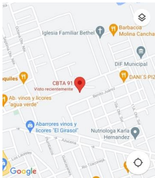
Ilustración 2 Ubicación CBTA91