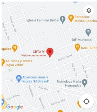
Ilustración 2 Ubicación CBTA91