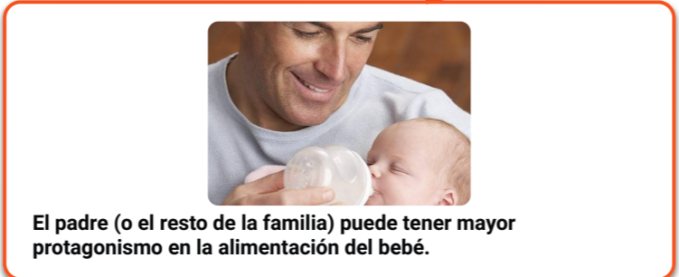
El padre (o el resto de la familia) puede tener mayor protagonismo en la alimentación del bebé.

Da más libertad de movimiento a la madre ya que puede salir de casa sin estar pendiente del horario y otra persona puede darle el biberón