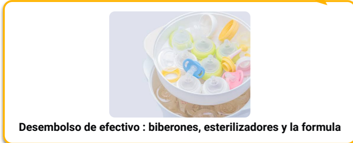
Desembolso de efectivo : biberones, esterilizadores y la formula

Se invierte tiempo en prepararla y tomar su temperatura