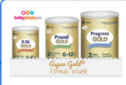
Tipos de leche