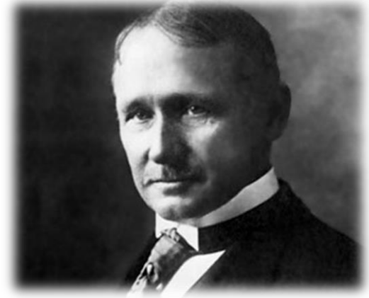
Frederick W. Taylor Padre de la administración científica