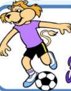
S o c c c e r