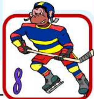
I c e H O c k e y