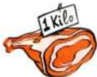
a kilo of meat