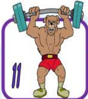
w e i g h t l i f t i n g