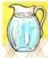
a jug of water