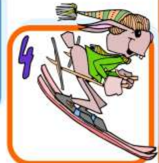
S k _ n