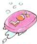
a bar of soap