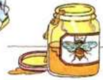
a jar of honey