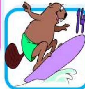
S u r f