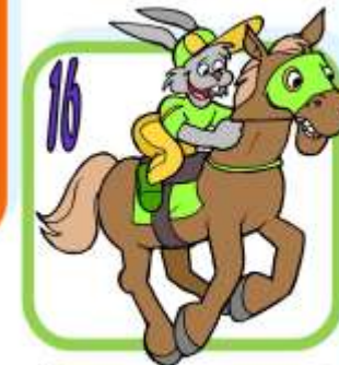
r i d i n g