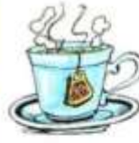
a cup of tea