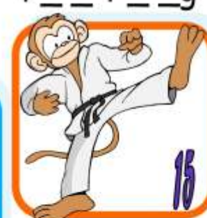
K a r a t e