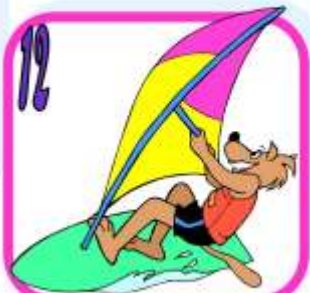
W i n d s u r f