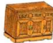
a piece of furniture