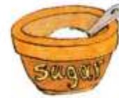
a bowl of sugar