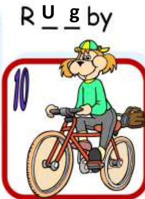
C Y c L i n g