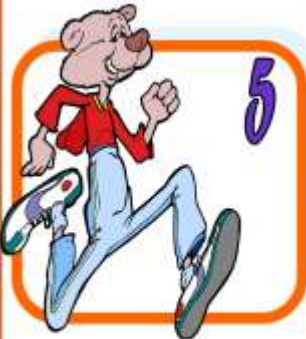
A t h l e t i c s