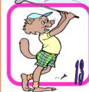
g O l f