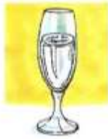
a glass of water