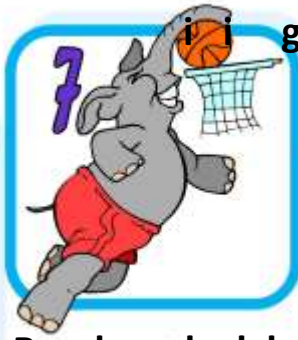
B a s k e t b a l l