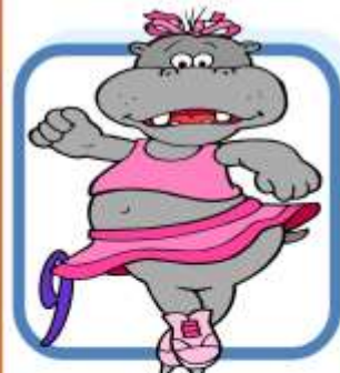
I e S _ t i _