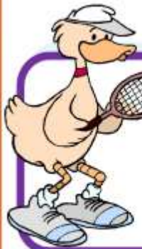
T e n n i s