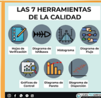
Diagrama de flujo Diagrama de Ishikawa (Fishbone) Tablas de datos Hojas de verificación Diagrama de Pareto Histogramas Diagrama de dispersión