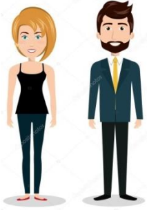
Mujer y Hombre.

Es el conjunto de creencias, prescripciones y atribuciones que se construyen socialmente tomando a la diferencia sexual como base.