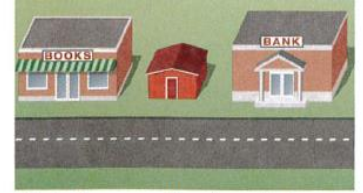
7. between the bookstore and the bank