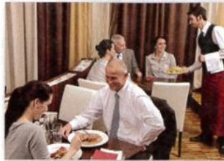
2. a restaurant