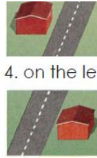
4. on the left