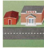
6. next to the bank