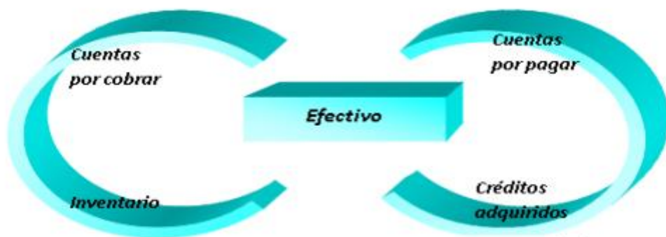
Figura 1.1 Ciclo financiero