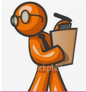
Funciones de la supervisión escolar

La supervisión escolar se fundamenta en el enfoque humanista, el cual, define al hombre como una entidad superior