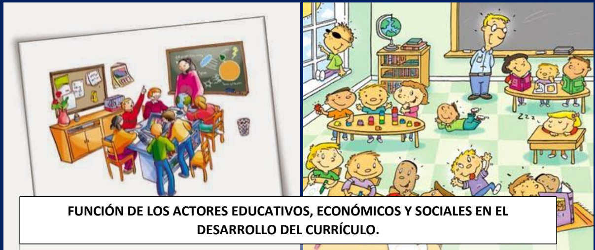
FUNCIÓN DE LOS ACTORES EDUCATIVOS, ECONÓMICOS Y SOCIALES EN EL DESARROLLO DEL CURRÍCULO.