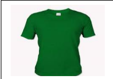
A green t-shirt