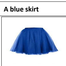
A blue skirt