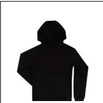
A black hoodie