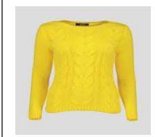
A yellow sweater