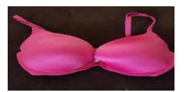
A pink bra