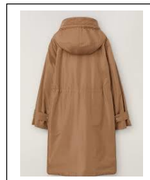
A Brown raincoat