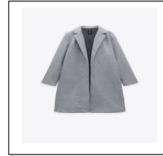
A grey coat