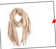
A beige scarf