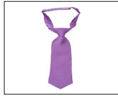
A purple tie