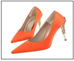
Orange high heels