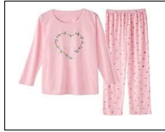
A pink pajama