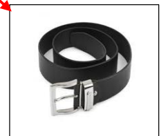
A black belt