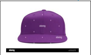
A purple cap