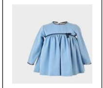
A light blue dress