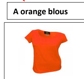
A orange blous