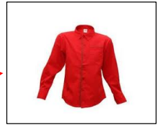
A red shirt