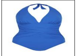
A blue swimwear