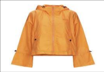
An orange jacket