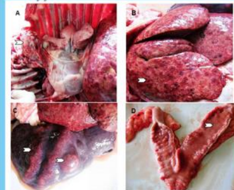
Figura 1. A. Masa redondeada multilobulada ubicada en el mediastino craneal. B. Hígado con múltiples focos necróticos comprometiendo toda la lobulilla. C. Cuatro focos necróticos en hígado en forma longitudinal y redondeada. D. Cuerno uterino con secreción purulenta pútrida.

Los pulmones están situados dentro del tórax, protegidos por las costillas y a ambos lados del corazón