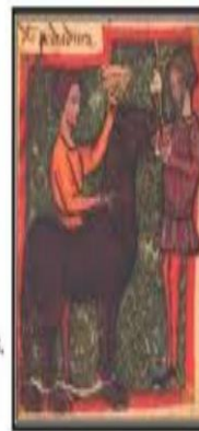
Se transmitió por generaciones.