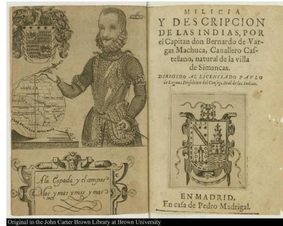
Original in the John Carter Brown Library at Brown University