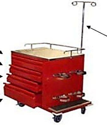
Soporte para colgar bolsa de suero o soluciones

CAJÓN # 4: Bolsas para reanimación, catéter para oxígeno, soluciones endovenosas