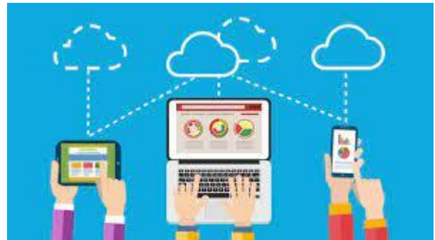
IMAGEN Y CAMBIO DE FORMATO