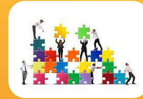
Evita lentitud e ineficiencia.