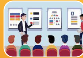
Suministra los métodos.