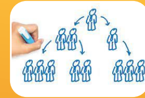
Reduce o elimina esfuerzos.