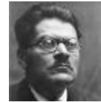
JOSE CLEMENTE OROZCO