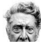
DAVID ALFARO SIQUEIROS