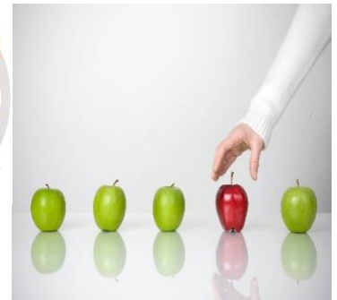
ESTRATEGIAS DE SEGMENTACIÓN DEL MERCADO