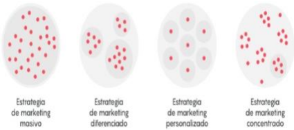
Estrategia de marketing masivo