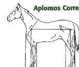
Caballo de aplomos normales visto de perfil.