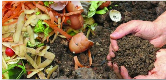
Materia orgánica Desechos, residuos y metabolitos de plantas, animales y microbios