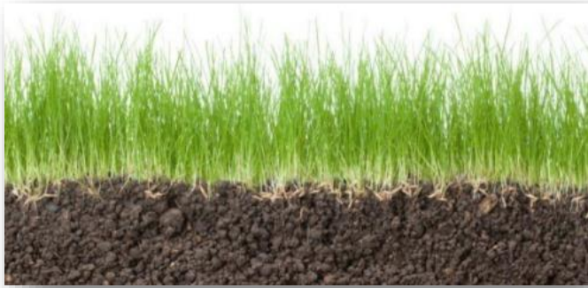
Plantas Brotos y raíces