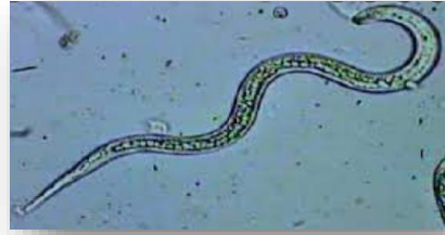
Nemátodos Consumidores de raíces