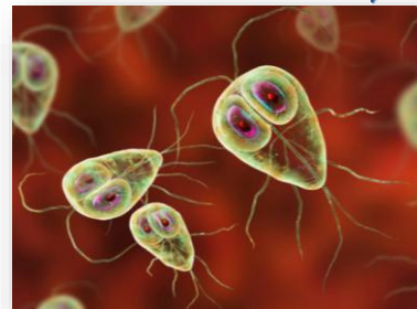
Protozoarios Amibas, flagelados y ciliados