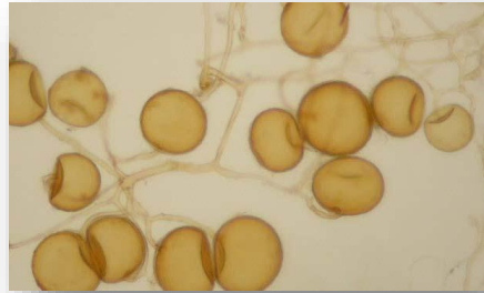
Hongos Hongos micorrizales y saprófagos