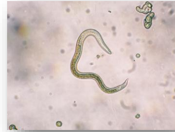
Nemátodos Consumidores de bacterias y hongos Depredadores