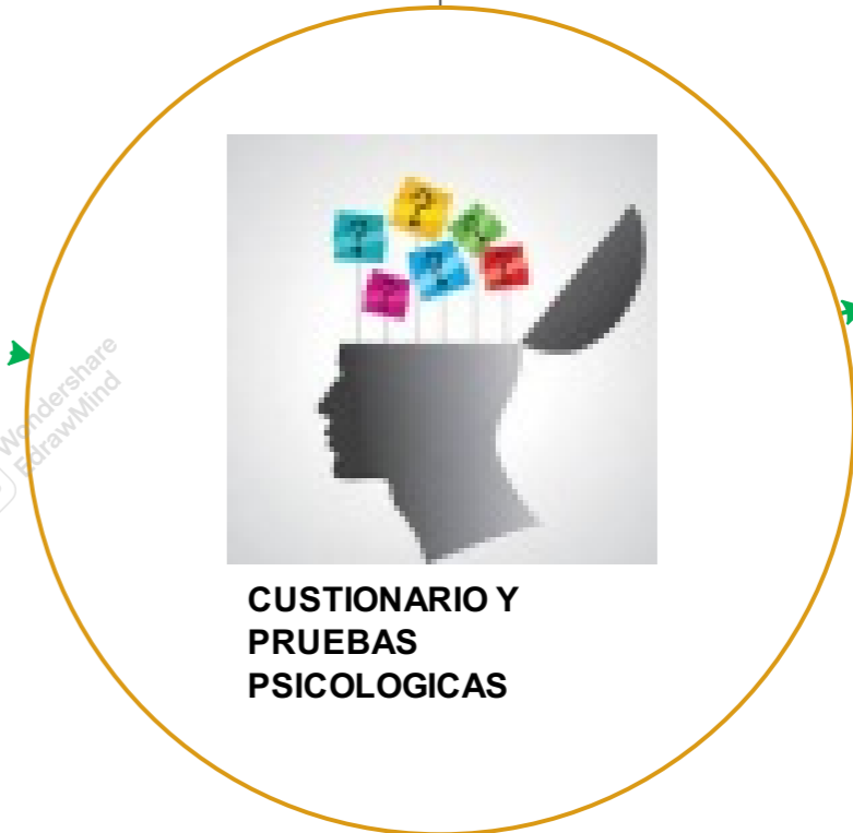
CUESTIONARIO Y PRUEBAS PSICOLOGICAS

pruebas escritas, orales, abiertas, cerradas, psicométricas, objetivas, subjetivas, proyectivas, estructurales, temáticas, expresivas y constructivas.