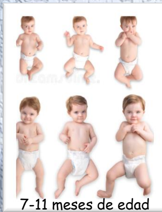
7-11 meses de edad