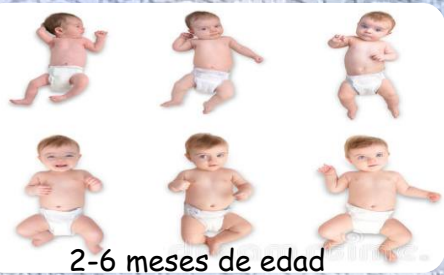
2-6 meses de edad

Estas herramientas difieren en complejidad y en el nivel de análisis racional que requieren.