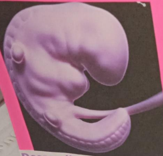
Desarrollo del bebé: mes uno de embarazo

Han pasado cuatro semanas de embarazo y el óvulo fecundado apenas alcanza un tamaño de 0.12 milímetros, su cabeza es tan solo del tamaño de un alfiler. Ha pasado por un proceso de división de células y ahora es un embrión que se adhirió a la pared del útero. En este mes, ese futuro bebé comienza a formar el corazón, extremidades, pulmones y tubo neuronal (cerebro y médula espinal).