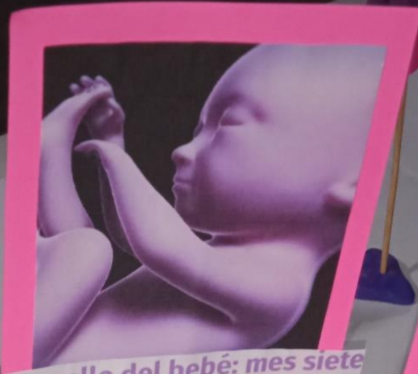
Desarrollo del bebé: mes siete de embarazo

El bebé creció de manera importante el mes pasado y ya tiene su rostro completamente bien definido, abre sus ojos y duerme en varios momentos del día, tiene cejas y pestañas. En el sexto mes es capaz de explorar su entorno y sus movimientos son con mayor fuerza. En esta etapa debes hablar mucho con tu bebé pues ya puede identificar sonidos.