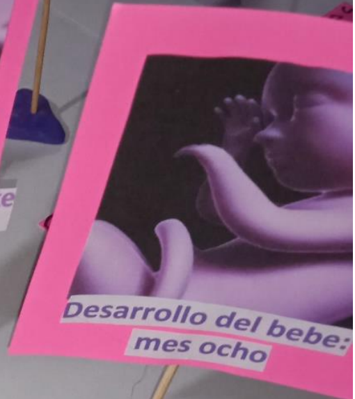
Desarrollo del bebé: mes ocho

El bebé ha crecido aún más y comienza a presionar tu vejiga (las ganas frecuentes de hacer pipi no se harán esperar) En este mes los pulmones maduran y se pigmenta la piel. Comienza a posicionarse para nacer el bebé.