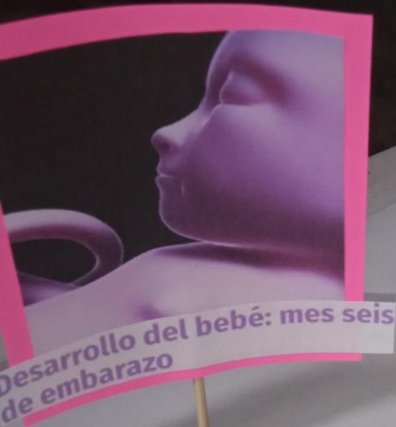
Desarrollo del bebé: mes seis de embarazo

El bebé creció de manera importante el mes pasado y ya tiene su rostro completamente bien definido, abre sus ojos y duerme en varios momentos del día, tiene cejas y pestañas. En el sexto mes es capaz de explorar su entorno y sus movimientos son con mayor fuerza. En esta etapa debes hablar mucho con tu bebé pues ya puede identificar sonidos.