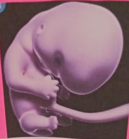
Desarrollo del bebé: mes dos de embarazo

Han pasado cuatro semanas de embarazo y el óvulo fecundado apenas alcanza un tamaño de 0.12 milímetros, su cabeza es tan solo del tamaño de un alfiler. Ha pasado por un proceso de división de células y ahora es un embrión que se adhirió a la pared del útero. En este mes, ese futuro bebé comienza a formar el corazón, extremidades, pulmones y tubo neuronal (cerebro y médula espinal).