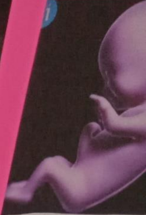
Desarrollo del bebé: mes tres de embarazo

El corazón comienza a latir a partir de la semana 5, los vasos sanguíneos se desarrollaron y la circulación sanguínea está conectada con la mamá. Aunque es muy pequeño, el saber que late su corazón, comenzará a llenarte de emoción. En este mes se desarrollan los testículos, estómago, hígado, riñones y páncreas. Se empezarán a distinguir los dedos de manos y pies, ¡podrá incluso succionar su dedo! Al finalizar este mes, tu bebé es de apenas dos centímetros.