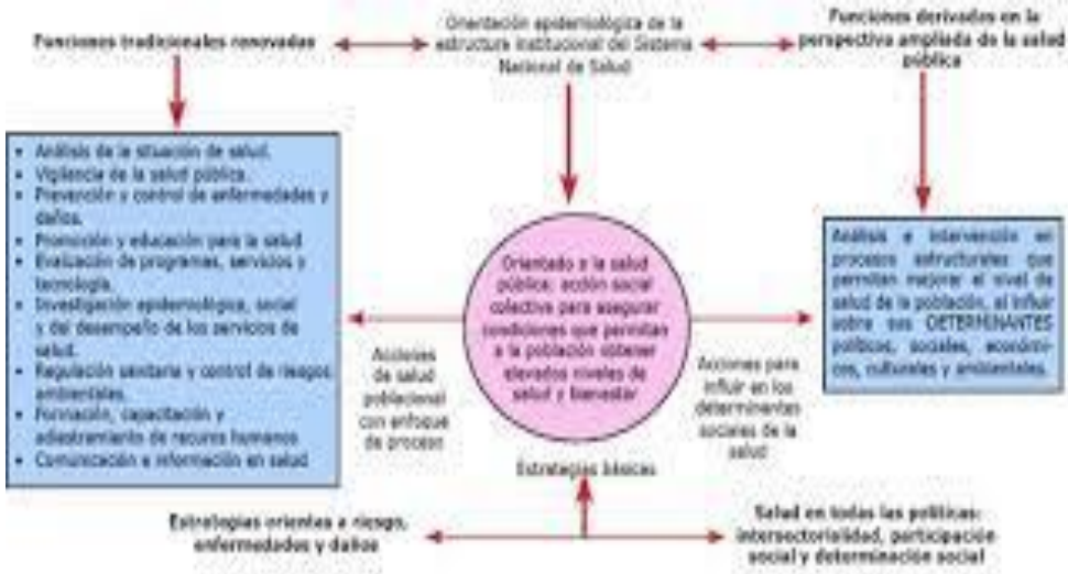
Fig. 2. Propuesta de funciones renovadas y nuevas para las áreas técnicas de las estructuras institucionales del Sistema Nacional de Salud.

“• Desarrollo y fortalecimiento de una cultura de la vida y de la salud. • Atención a las necesidades y demandas de salud. • Desarrollo de entornos saludables y control de riesgos y daños a la salud colectiva. • Desarrollo de la ciudadanía, y de la capacidad de participación y control sociales.”