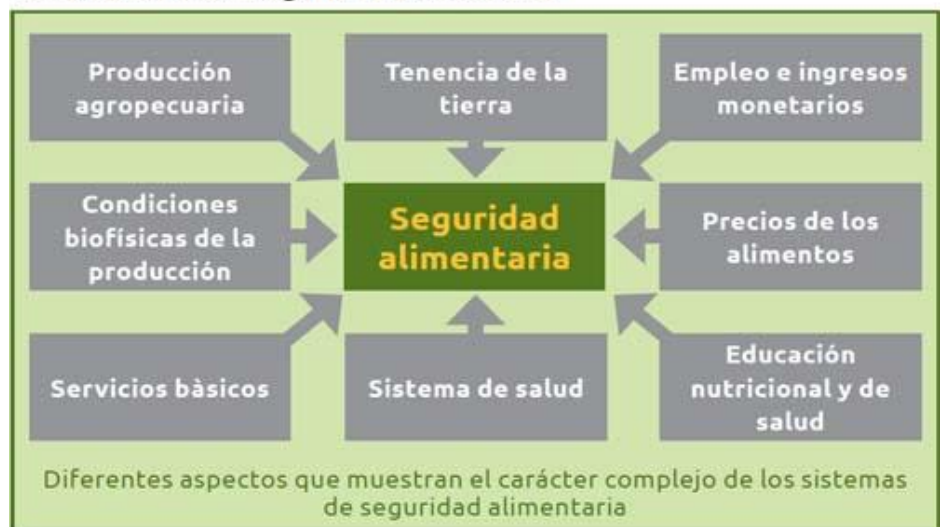
Figura 1. Ejemplos de diferentes factores y procesos que influyen en el sistema de seguridad alimentaria

La higiene de alimentos incluye cierto número de rutinas que deben realizarse al manipular los alimentos con el objetivo de prevenir daños potenciales a la salud. Los alimentos pueden transmitir enfermedades de persona a persona, así como ser un medio de crecimiento de ciertas bacterias.