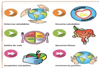
Ejemplos de promoción de la salud

Asegurar que el ambiente que está más allá del control de los individuos sea favorable a la salud legislación, medidas fiscales, cambio organizativo y desarrollo comunitario