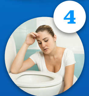
Trastorno por purgas