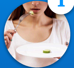
Anorexia nerviosa atípica