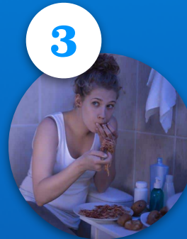
Trastorno de atracones