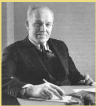
EDUARD C. LINDEMAN 1885-1953

En sus libros menciona que la mejora social se centra en lo teórico y lo práctico, los problemas que atañen a los trabajadores sociales a sí como también las situaciones que ocasionan la pobreza.