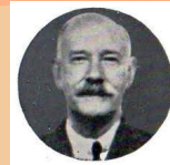
RICHARD H. TAWNEY 1880-1902

Insistió en que la educación de trabajo social se debe conducir bajo auspicios de la universidad a nivel graduado, también la necesidad de la enseñanza en campo.