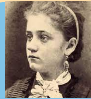
JAMES ADDAMS 1860-1935

El movimiento de los asentamientos sostenía que la pobreza derivaba de condiciones sociales adversas (hincapie en la reforma social).