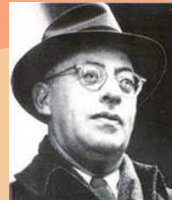
SAUL ALINSKY 1909-1972

Influyó mucho en la profesión del trabajo social con un plan de estudios centrado en el estudio de casos. Su teoría establece una relación entre el crecimiento humano y del comportamiento a lo largo de su vida.