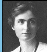
EDITH ABBOTT 1876-1957

Practicó el trabajo social profesional, la organización de la comunidad y la educación social mediante estrategias.