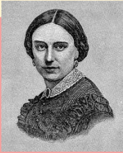
MARY E. RICHMOND 1861-1928

Fue visitadora amigable. Se caracterizó por la acción caritativa hacia los marginados (entrevistaba y organizaba). Ella le da solides al trabajo social con base teórica y científica.