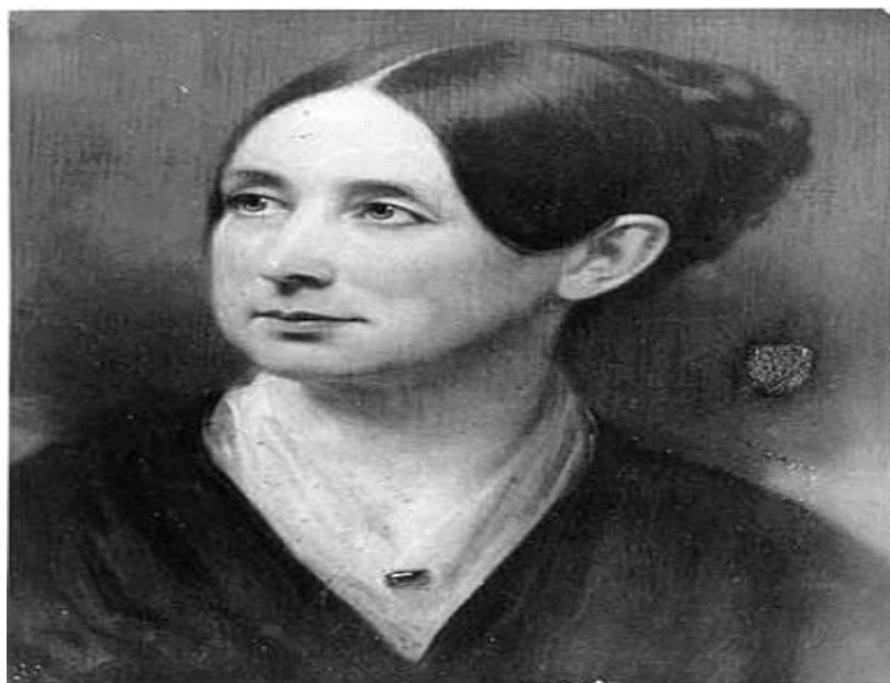
DOROTHEA LYONDE DIX