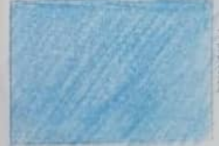
Colorea en forma diagonal