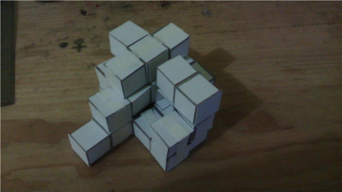
Tumba del Snto