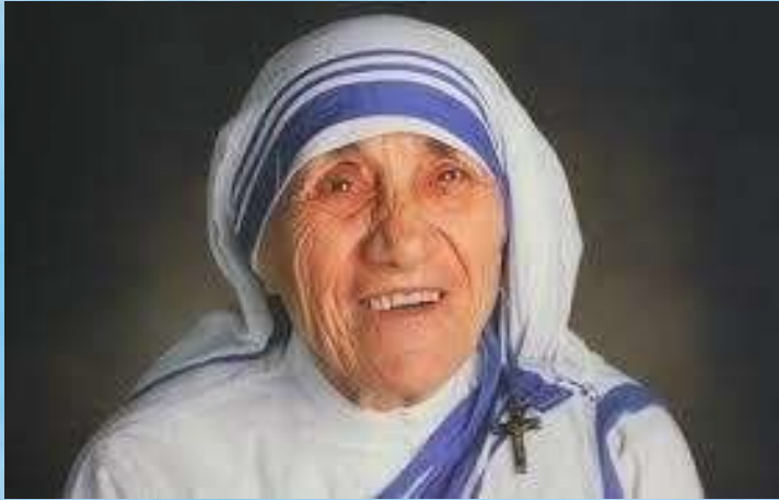
Teresa de Calcuta