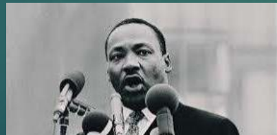
MARTIN LUTHER KING

Su lucha por la igualdad entre negros y blancos fue crucial. Entre sus actos, destaca su multitudinario mitin frente a cientos de miles de personas en el capitolio de Washington. También recibió el Premio Nobel de la Paz en 1968.