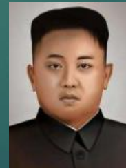
KIM JONG UN

Jefe de estado de Corea del Norte. Su país se encuentra a día de hoy prácticamente aislado, siendo una difícil tarea poder entrar o salir de él. Su mandato, heredado de su padre, está impuesto de sus propios ideales, basados en una cultura militar.