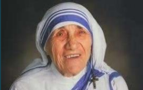
TERESA DE CALCUTA

Fue una misionera que centraba sus esfuerzos en ayudar a los más desfavorecidos. Fundó la congregación de las Misioneras de la Caridad en 1950, organización que a su muerte (1997) contaba con nada más y nada menos que con más de quinientos centros y un centenar de países.