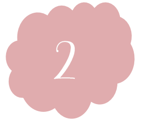
Stephen E. Toulmin

Su obra principal se llama: The Uses of Argument , Para Toulmin, en el proceso de establecer un modelo argumental existen cuatro elementos: la pretensión, las razones, la garantía y el respaldo. Con Toulmin se está frente a una auténtica teoría de la argumentación, ya que no pretende ofertar un paradigma que sirva para los saberes jurídicos, sino para el ámbito de la argumentación en general.