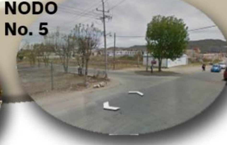
NODO No. 5