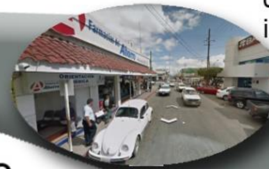
NODO No. 1