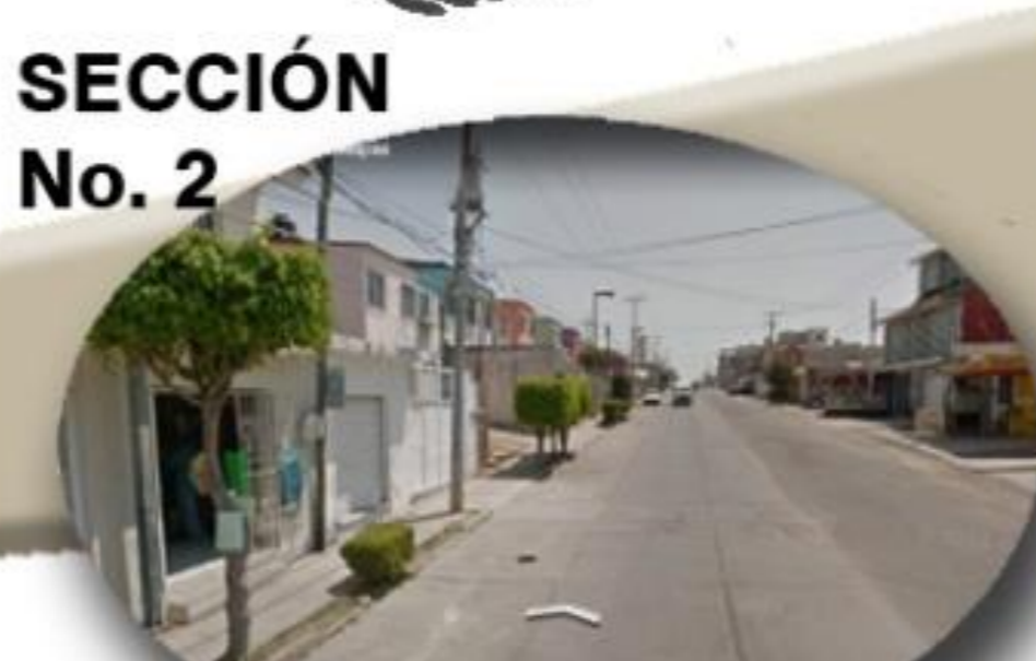
SECCIÓN No. 2