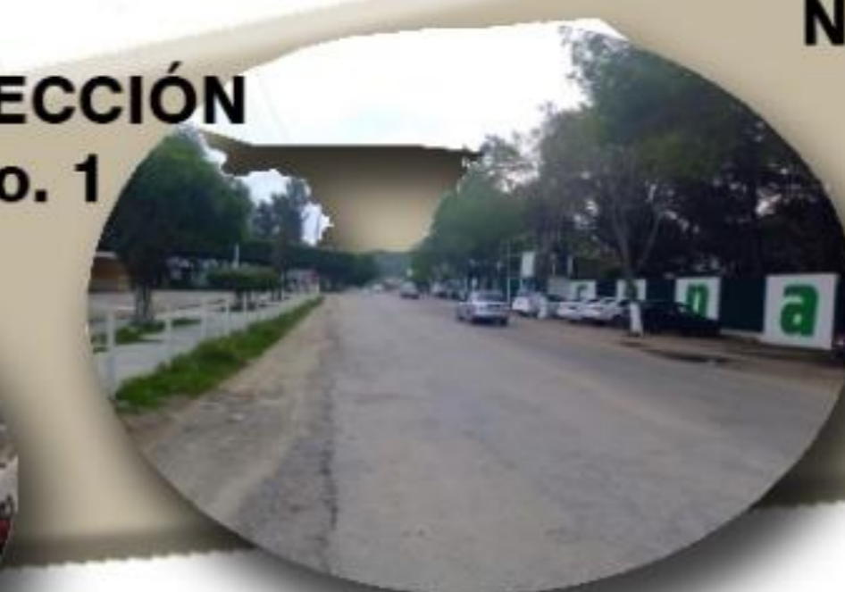
SECCIÓN No. 1