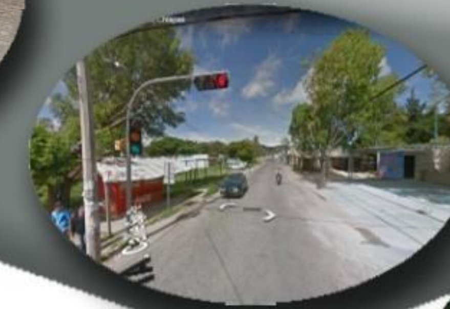
NODO No. 3