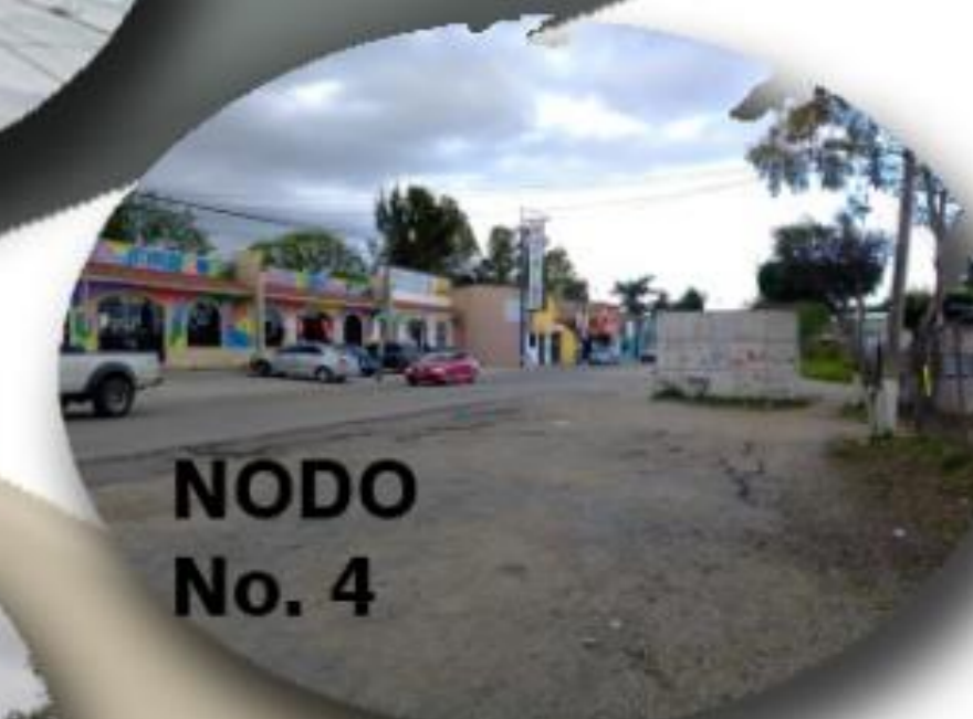
NODO No. 4