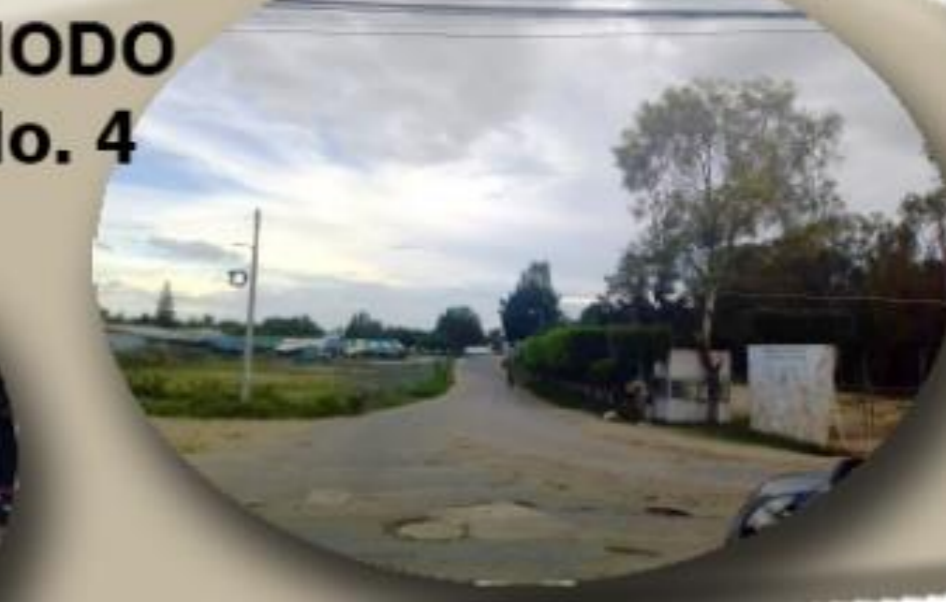
NODO No. 4