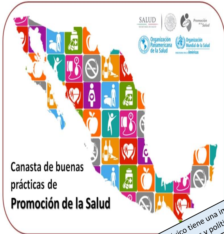
Canasta de buenas prácticas de Promoción de la Salud

México tiene una implementación de programas y políticas alimentarias