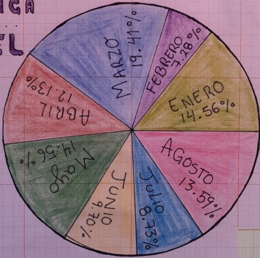
GRAFICA de... PASTEL